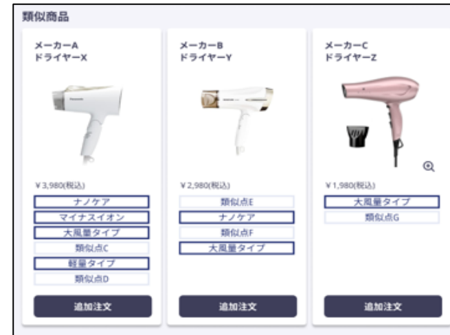
注文リスト画面(従業員側)

※ ノジマモバイル会員様(新規ノジマモバイル会員様含む)が対象となります。 ※ 「QRコード」は株式会社デンソーウェブ様の登録商標です。