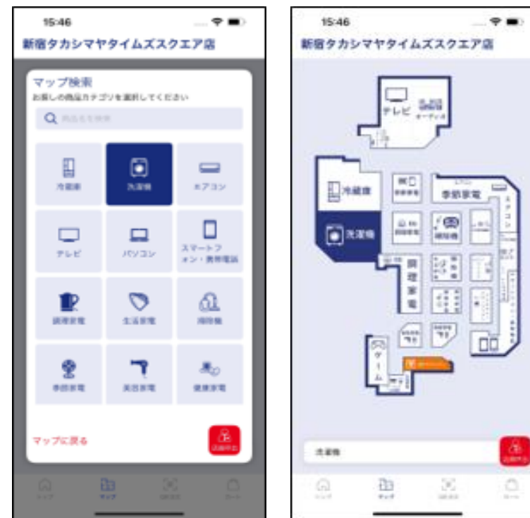
店舗内マップ画面(お客様側)

さらに、画面右下「店員呼出」ボタンを押すことで、従業員を呼び出すことができます。お客様の「忙しそうで、声がかげずらいな・・・」、「声をかけるの手間だな・・・」等のお困りごとの解決にも繋がり、商品説明等のご要望に迅速にお応えする事が可能です。