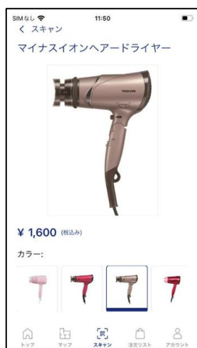
QRコード読み取り後の画面(お客様側)