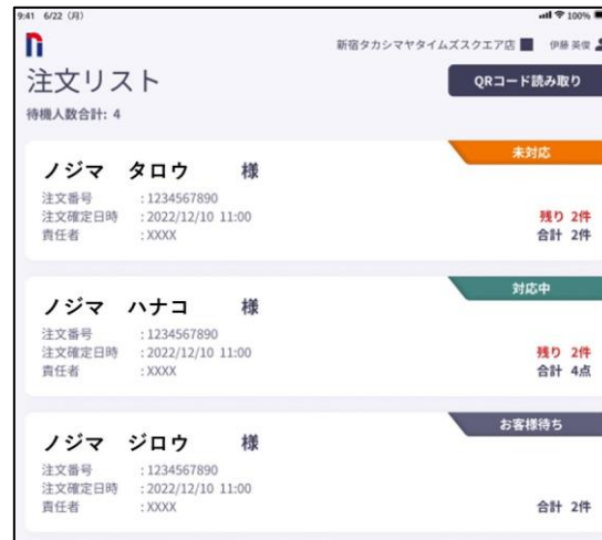
注文リスト画面(従業員側)